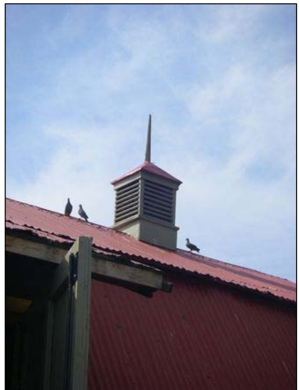
Lanterneau visible au sommet d'une grange-étable localisée au 114, chemin de la Vallée, La Malbaie (Rivière-Malbaie).