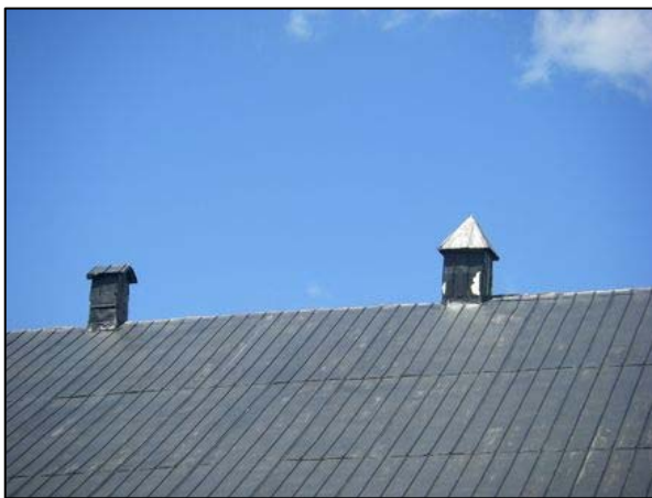
Évents disposés sur la ligne faîtière d'un bâtiment agricole situé au 485, rang Saint-Nicolas, Saint-Irénée.

Un certain nombre de campaniles, de lanterneaux et d'évents plus ou moins élaborés sont visibles sur l'ensemble du territoire de la MRC de Charlevoix-Est. Ces éléments architecturaux sont visibles notamment sur les chemins du Gros-Ruisseau et de la Vallée, à La Malbaie, ainsi que sur le rang Saint-Nicolas, à Saint-Irénée.