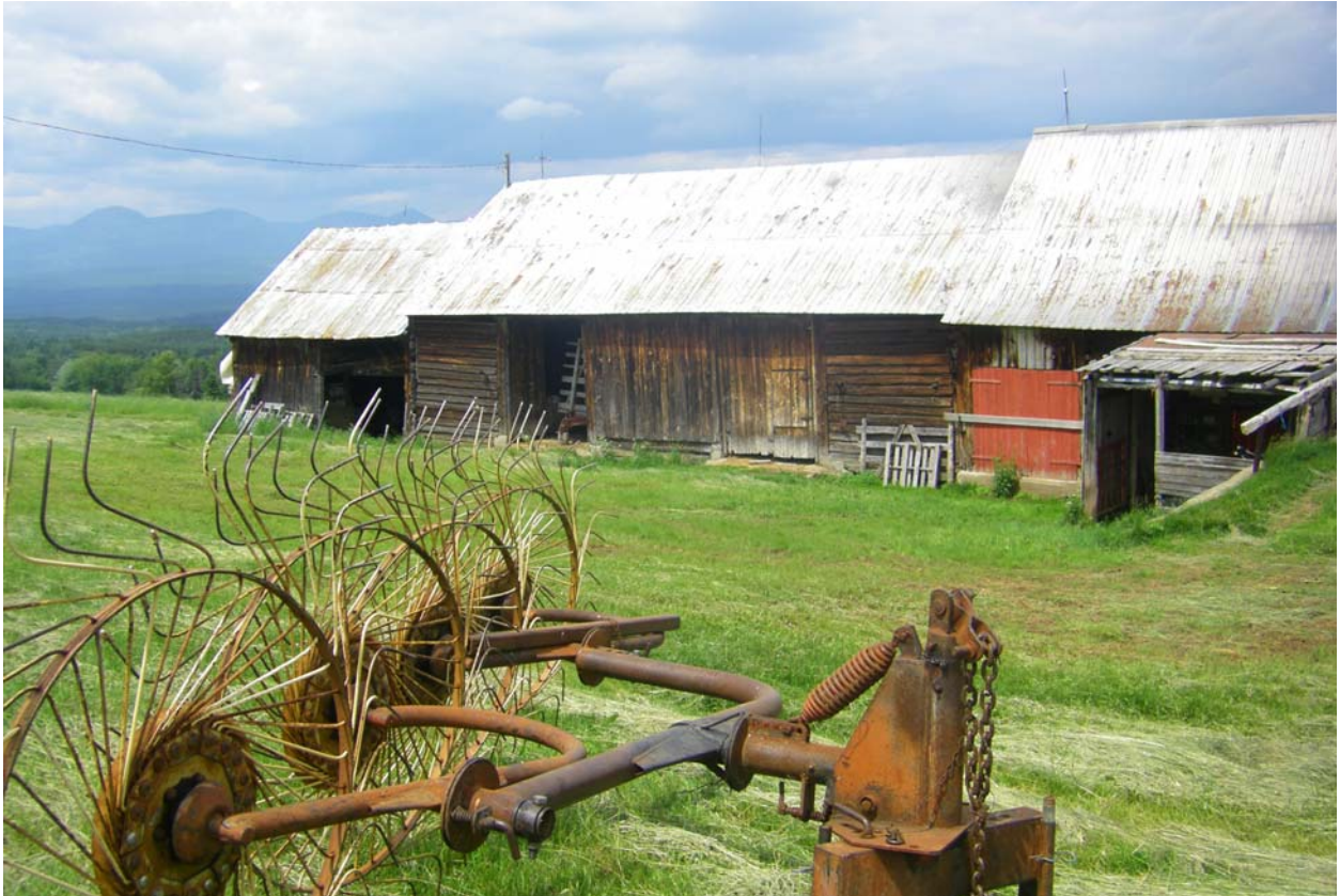
Grange-étable située au 18-21, rang des Lacs, Notre-Dame-des-Monts. Patri-Arch, 2011