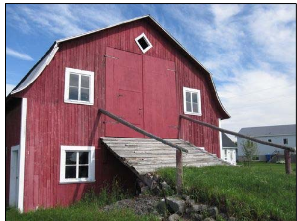
Grange-étable située au 440, route de la Grande-Alliance, Baie-Sainte-Catherine.