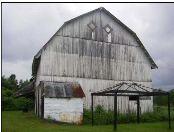
Grange-étable sise au 37, rang des Lacs, Notre-Dame-des-Monts

Moins répandues que les événements de toiture, les lucarnes sont principalement destinées à ventiler et éclairer l'intérieur des granges, tout en facilitant l'engrangement du foin dans le fenil. Pourvues de fenêtres à carreaux ou de portes à battants sans vitrage, les lucarnes se déclinent généralement sous trois formes : la lucarne à pignon droit, la lucarne rampante et la lucarne à toit brisé. Visibles tout particulièrement sur les bâtiments surmontés d'un toit brisé ou mansardé, ces ouvertures rappellent celles des résidences ancestrales de la MRC de Charlevoix-Est.