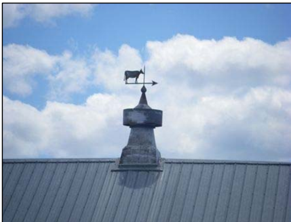
Évent doté d'une girouette visible au 70, chemin du Gros-Ruisseau, La Malbaie.